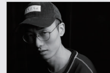
武宇杰 深圳海马体照相馆 摄影师 摄影主管