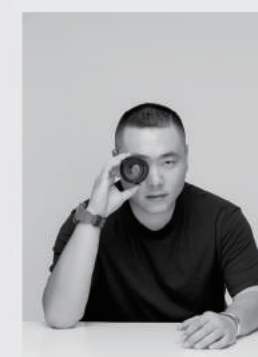
潘佳宇 北京海马体照相馆 摄影师