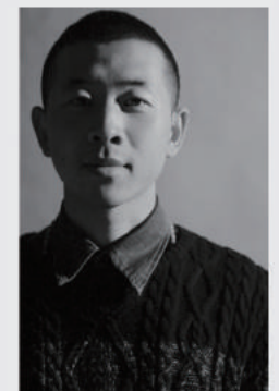
郝翼飞 内蒙古位图文化传媒有限公司 摄影师 8KRAW 签约摄影师 抖音账号：露营记 粉丝 2 万